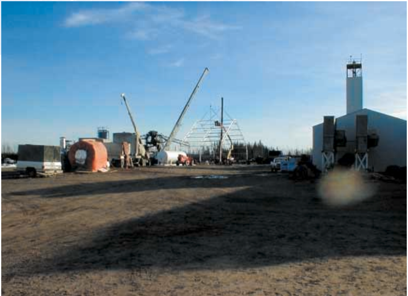
Ansicht der Einhäusung der gesamten DMS-Anlage