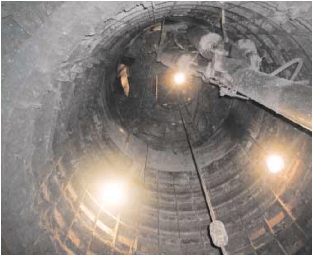
130 m Teufe im Schacht, Blick nach oben

Über die ersten 110 Schachtmeter hinweg traten immer wieder Lehm- und Schluffstein-Bänke auf, die sich als sehr schwierig zu bohren und lösen erwiesen. Obwohl der Schacht gefroren war, mussten die Bohrungen zur Spülung der Bohrlöcher mit Sole niedergebracht werden. Diese verschlammten infolgedessen, so dass der Einsatz von Hohlbohrstangen und das Arbeiten mit kurzen Abschlagen erforderlich war. Metamorpher Kimberlit wurde dann bei ca. 110 m angetroffen. Die dabei auftretenden ungünstigen Gesteinsverhältnisse veranlassten uns, die Schalung ungewöhnlich dicht an der Schachtsohle zu halten.