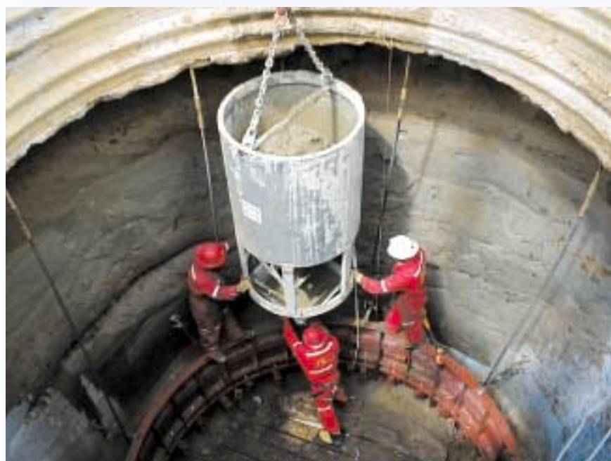
Betonieren des Schachtkragens

Die Schachtschalung wurde auf die Teufsohle gesetzt sowie die mehretägige Schwebebühne (Galloway) in den Schacht hinabgelassen und verankert. Anschließend konnten sowohl das Teufgerüst als auch die Winden wie Galloway-, Greifer-, Schalungs- und seitliche Winden befestigt werden. Nach der Inbetriebnahme und Durchführung aller Sicherheitskontrollen begannen die Teufarbeiten wieder, wobei sich die Arbeitszeit auf drei 8-Stundenschichten pro Tag erhöhte.