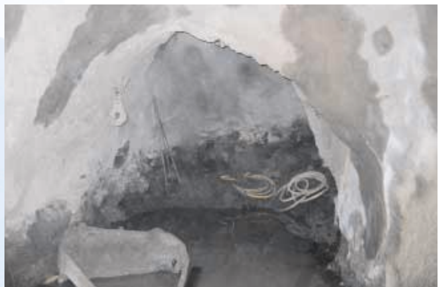
Herstellen des Füllortes, 175 m-Sohle

Der Querschnitt des Füllortes verringerte sich zum Streckenübergang hin auf 2,4 m x 2,4 m. Anschließend folgte noch die Auffahrung einer Schrapperkurve sowie Räume für elektrische Schaltein-