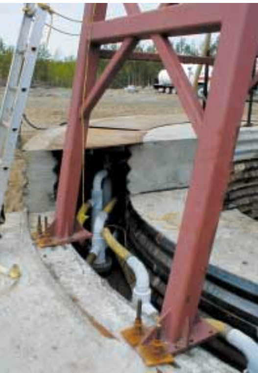
Darstellung des Gefrierkellers

Schachtes auf 250 m bis in das Zentrum des Star-Kimberlits mit dem Ziel, insgesamt 25.000 bis 30.000 t Kimberlit zu gewinnen.